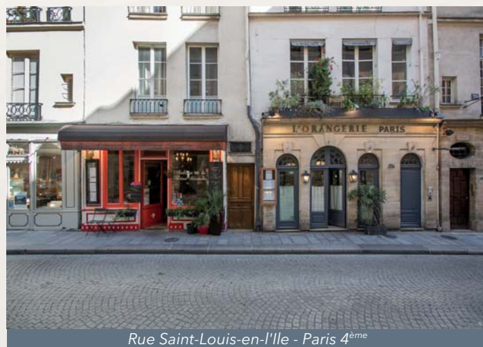
Rue Saint-Louis-en-l'Île - Paris 4 ème

Exemples d'investissements ne préjugent pas des investissements futurs