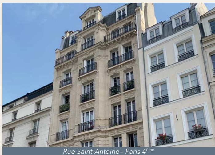
Rue Saint-Antoine - Paris 4 ème

(2) Total hors droits et hors frais retraité des honoraires initialement inclus dans le prix d'acquisition de certains actifs.