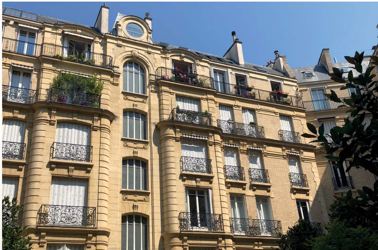
Rue de la Pompe - Paris 16 ème

Exemple d'investissement ne préjugant pas des investissements futurs