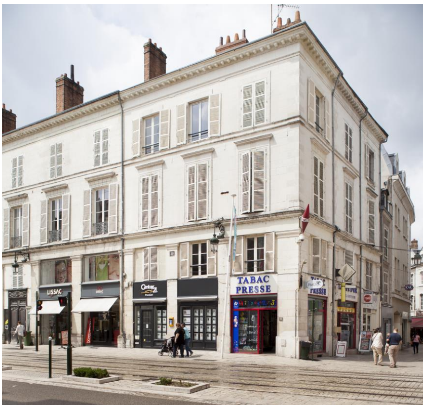
28 rue Jeanne d'Arc à Orléans (45)

Au 31 décembre 2015, en dehors des procédures engagées à l'encontre des locataires en retard dans le paiement de leur loyer, aucun autre litige n'a fait l'objet d'une provision. La provision de 30 K€ relative à la réclamation d'un locataire sur un actif situé à Compiègne concernant des refacturations de charges locatives sur plusieurs exercices, a été intégralement reprise au 31/12/2015 suite à un jugement condamnant SOFIPIERRE à rembourser 28 K€ à ce titre.