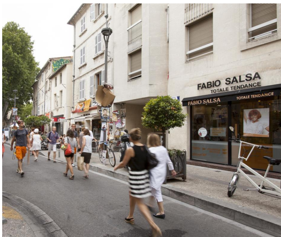
28 place des Corps Saints à Avignon (84)

(5) Dividende brut avant prélèvement obligatoire versé au titre de l'année N, rapporté au prix acquéreur moyen de l'année N