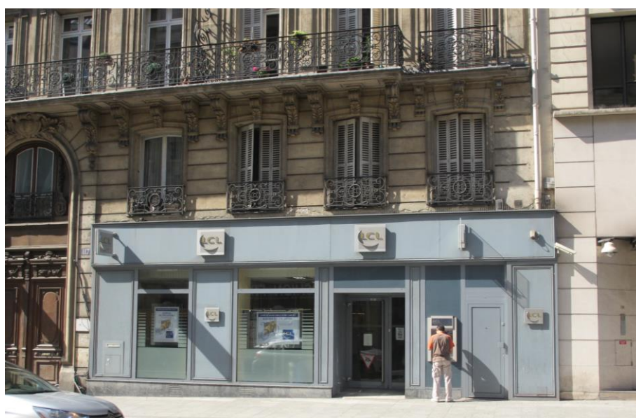
115-117 rue Lafayette à Paris (10 ème )