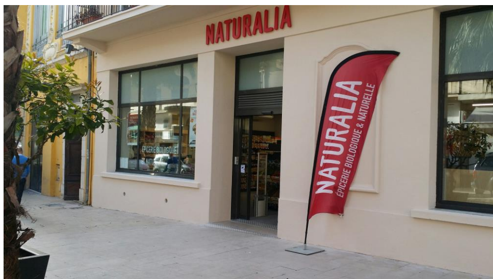
15-17 boulevard du Jeu de Ballon à Grasse (06)