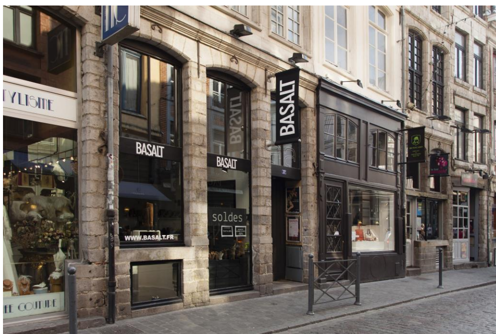
37 rue Lepelletier à Lille (59)