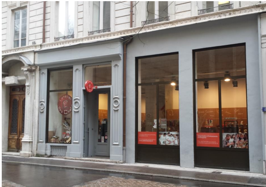
46 rue Ed. Herriot – Lyon (2 ème )

Concernant les informations comptables et financières de la SCPI, les procédures de contrôle interne des services comptables intègrent notamment la production de prévisions trimestrielles, l'analyse des écarts entre les comptes trimestriels et les prévisions, la mise en œuvre de contrôle de 1 er et 2 nd degrés et la permanence de la piste d'audit.