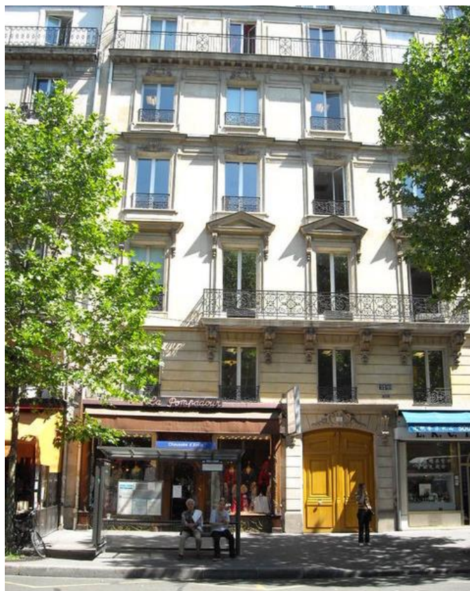
32 bis bd Haussmann à Paris (9 ème )

L'ensemble des diagnostics et plans d'actions a été piloté de juin 2011 à fin 2012 par un consultant dédié à ces aspects dont sa mission a consisté à mettre en place des outils de pilotage et de reporting ainsi qu'à sensibiliser les équipes et les prestataires aux meilleures pratiques. Ces outils et bonnes pratiques sont désormais intégrés dans les process de gestion immobilière. La gestion de la « performance durable » des actifs immobiliers participe fortement à leur valorisation financière dans le temps.