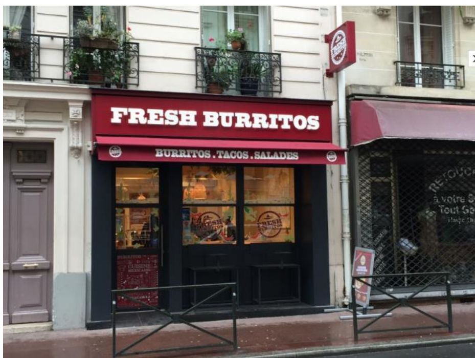
Rue Aristide Briand – Levallois (92)

Seul le Directeur Général de SOFIDY est soumis à l'ensemble des mesures édictées par la Directive AIFM applicable à la rémunération variable (indexation sur la performance long terme, versements différés, etc...).