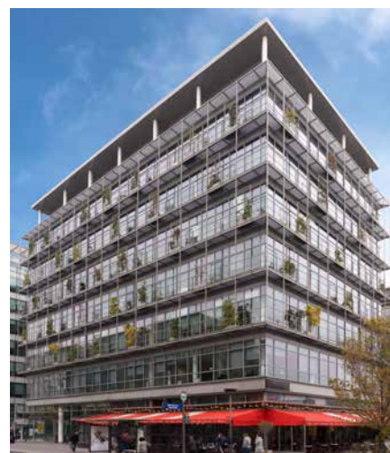
Parc Avenue - 82-90 avenue de France - 75013 Paris