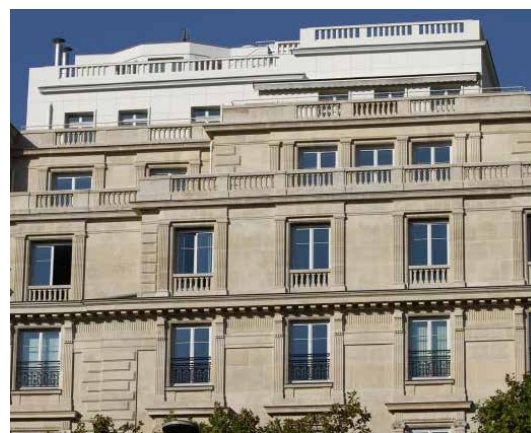
136 avenue des Champs Elysées - 75008 Paris