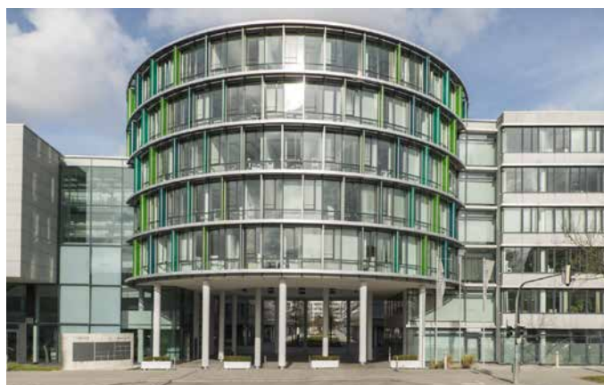
Loopsite - Werinherstrasse 78,81,91 D 81541 - Munich - Allemagne