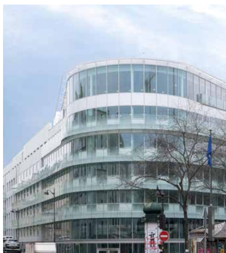
Intown - Place de Budapest 75009 Paris