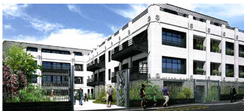
114 avenue Henri Barbusse – 92600 Asnières sur Seine VEFA