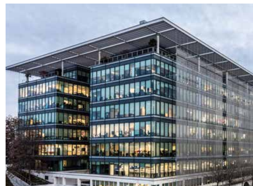
La Mahonia 2 – Madrid – Espagne