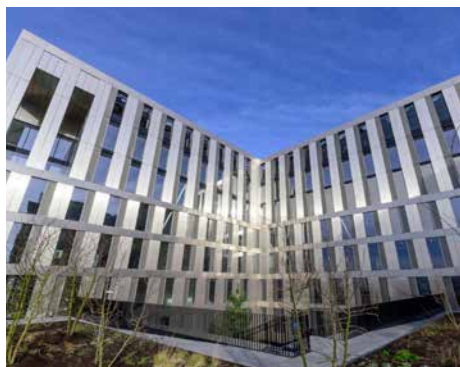
81 rue Mstislav Rostropovitch – 75017 Paris