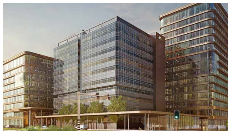
Atrium - Strawinskylaan 3001-4111 - Amsterdam - Pays-Bas