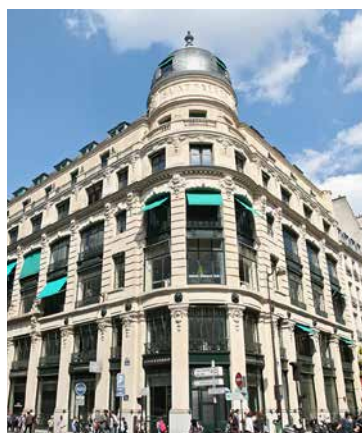
34 rue du Louvre - 75001 Paris