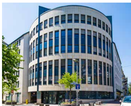
BBW – Grafstrasse / Wildungerstrasse Francfort – Allemagne