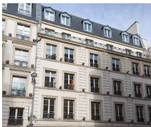
94 rue de Provence - 75009 Paris