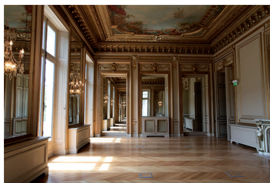
Paris - Avenue des Champs Elysées