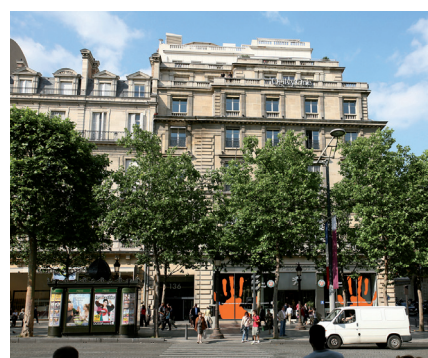
Paris - Avenue des Champs Élysées