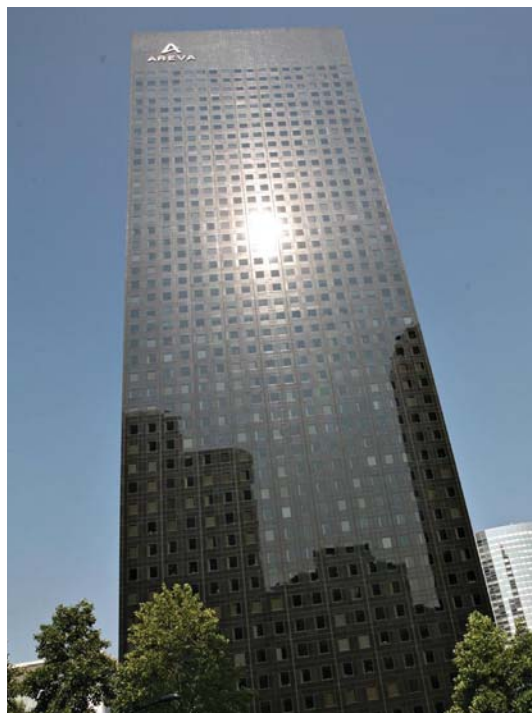
Paris la Défense - Tour Areva