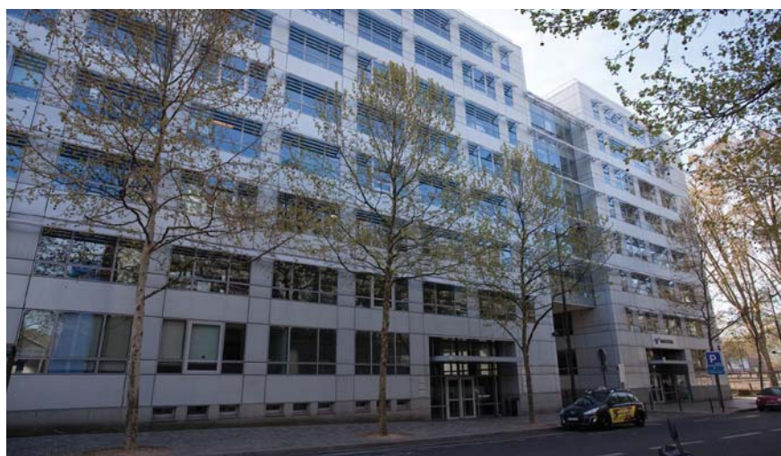
Paris - Rue de Pirogues