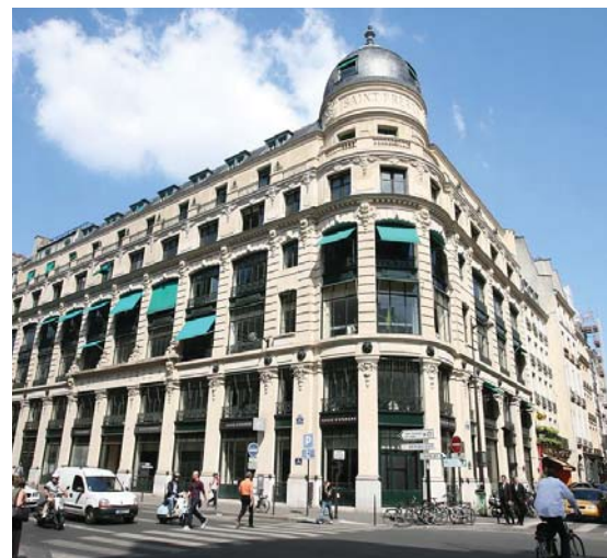
Paris - Rue du Louvre