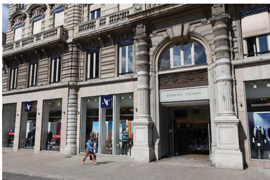
Lyon - Place des jacobins