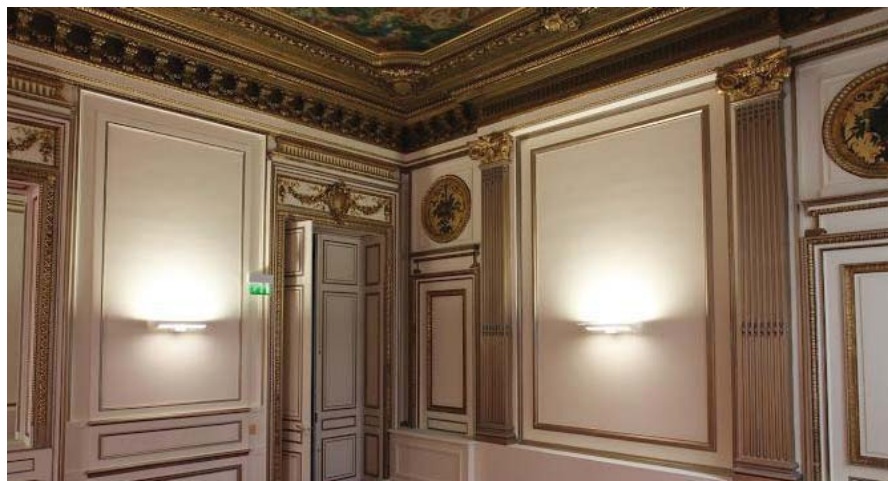
Paris - 136, Avenue des Champs Elysées