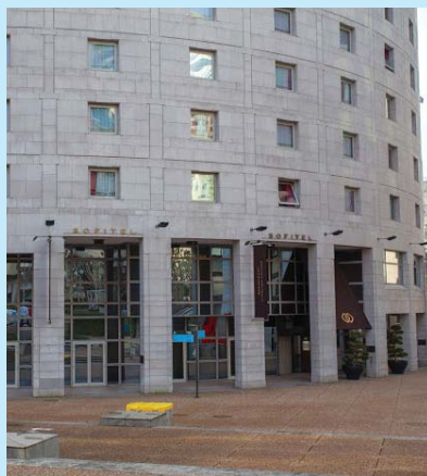
Sofitel - La Défense