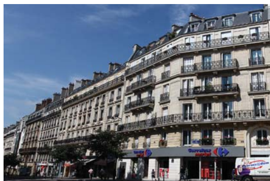
Paris - Rue Maubeuge