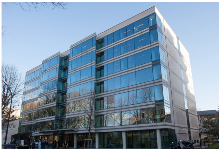
Neuilly-sur-Seine - Riva