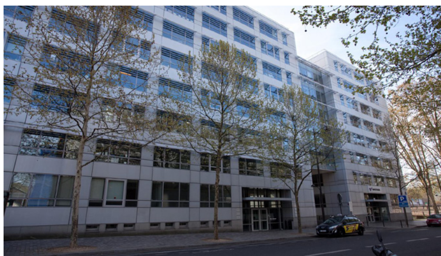
Paris - Rue de Pirogues