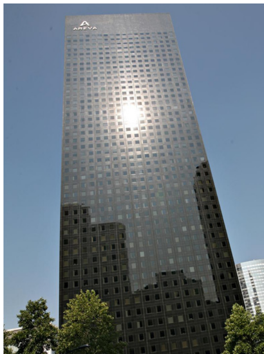
Paris la Défense - Tour Areva