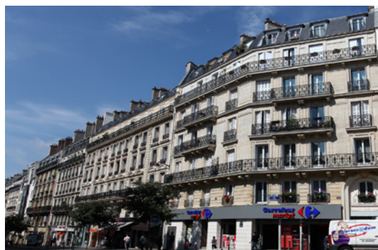
Paris - Rue Maubeuge