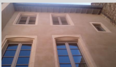
Nîmes (60, bd Gambetta)