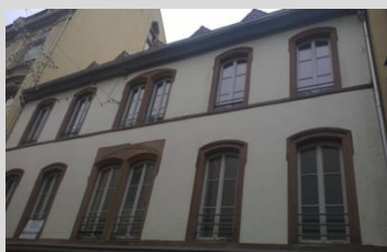
Colmar (16, rue des Prêtres)