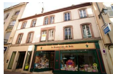
Colmar 16 rue des Prêtres

*sauf prorogation décidée par l'Assemblée Générale