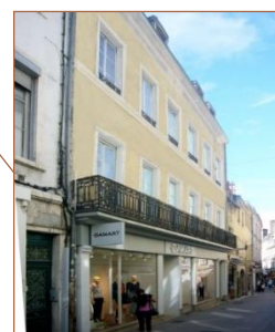
Chalon sur Saône (71)