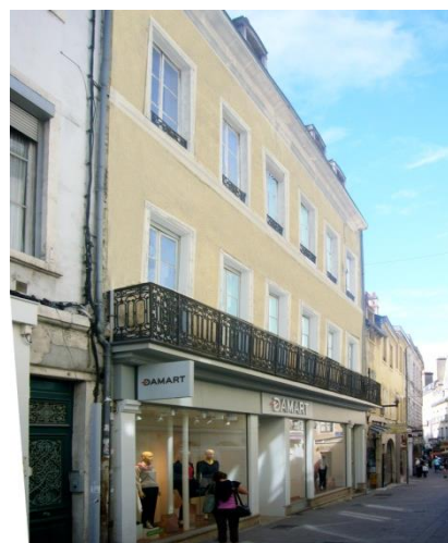
Chalon sur Saône