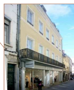
Chalon sur Saône (71)