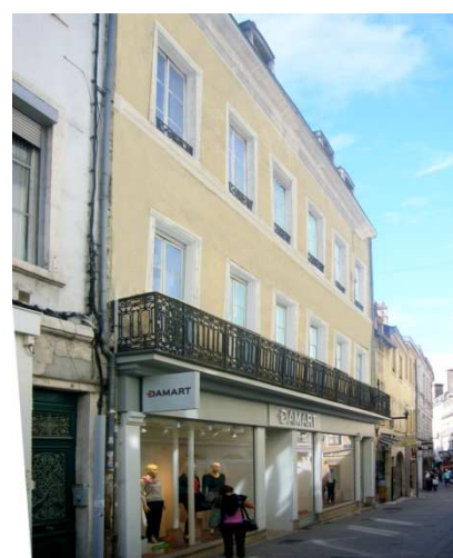
Chalon sur Saône