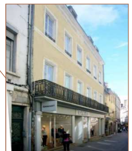
Chalon sur Saône (71)