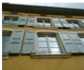
Le Puy en Velay (43)