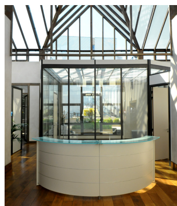
BOULOGNE (92) Rue Saint-Denis

Aucune acquisition n'a été réalisée au cours du 1 er trimestre 2013 mais 2 immeubles à usage de commerces en Province font l'objet d'une promesse de vente et devraient être acquis au cours du 2 ème trimestre 2013 pour un montant d'environ 2,1 M€ pour un rendement net moyen de 8,87%.