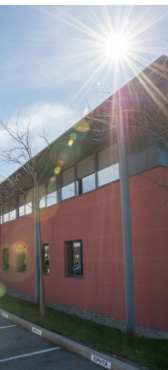
AIX EN PROVENCE (13) «Parc les Alizés» Rue Paul Langevin