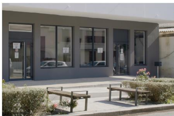
Espace d'accueil & bureaux