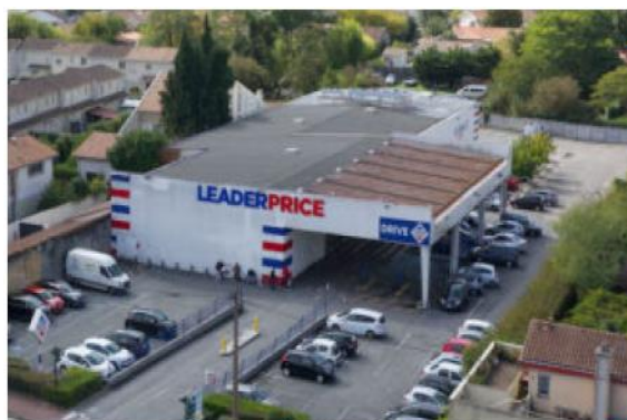
Commerce alimentaire Villeneuve d'Ornon (33)