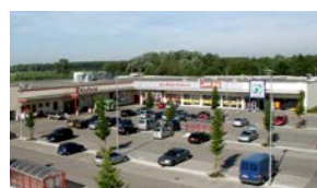
10. MOOSBURG Kaufland, AWG...