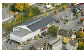
3. MESCHEDÉ Rewe, Aldi, McDonald