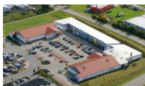
5. PFALZGRAFENWEILER Penny, Lidl, dm...