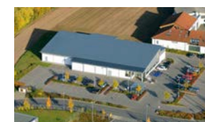
12. EBERSDORF Aldi