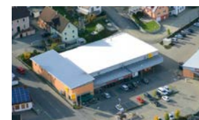
8. OCHSENHAUSEN Netto, AWG...