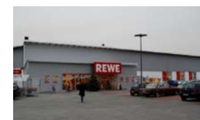
4. ILVESHEIM Rewe