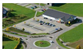
6. DEISSLINGEN Netto