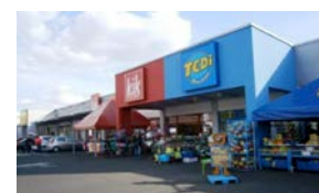
16. RANSBACH-BAUM. Penny, dm, Kik...