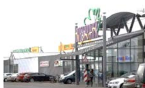
15. RIESA Real, Toom, Rossmann...