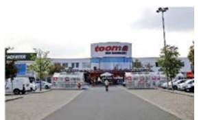
14. LEIPZIG Toom