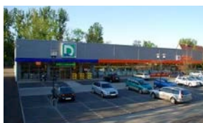
7. MÖSSINGEN Deichmann, Müller