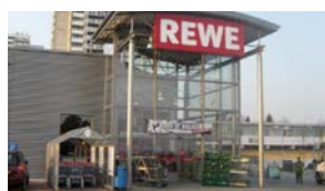
9. ULM BÖFINGEN Rewe, Lidl