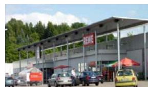
20. SEESEN Rewe, Aldi, dm...