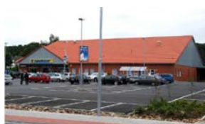
1. HIDDENHAUSEN Edeka