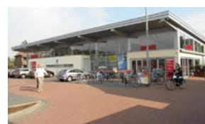
2. TÖNISVORST Rewe