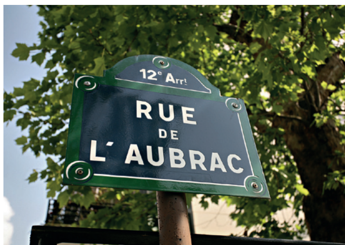
Rue de l'Aubrac Paris 12 e