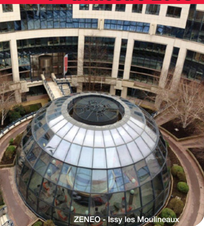
ZENEO - Issy les Moulineaux