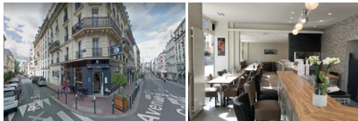
Les Assises de la Pierre Papier

80 avenue du Général de Gaulle 94120 SAINT MANDE