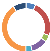
Répartition du patrimoine par ville (m 2 )

■ Cologne ■ Francfort ■ Wolfsburg ■ Brême ■ Essen ■ Munich ■ Hanovre