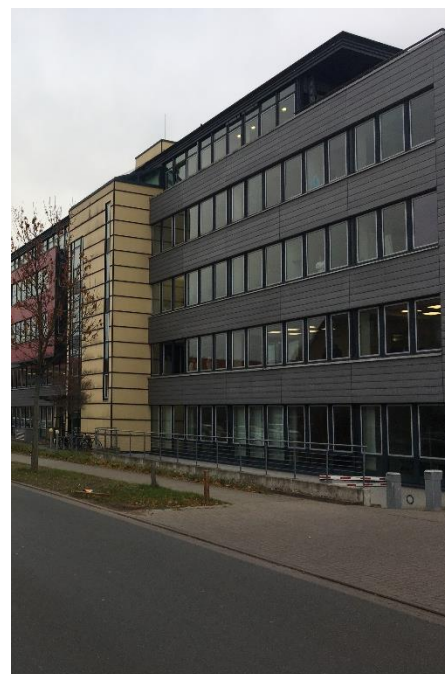
10 ème acquisition - Hanovre

Le premier acompte sur dividende a été distribué fin avril 2019 au titre des bénéfices réalisés au premier trimestre 2019. L'acompte trimestriel s'élève à 10 € pour une part en pleine jouissance sur le trimestre.