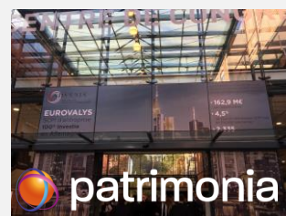
Expo Real (Munich)