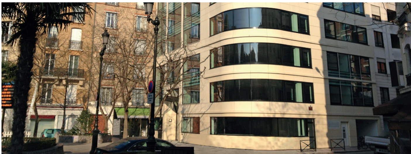
6/8, place Jean Zay - Levallois Perret (92)

Valable jusqu'à la parution du Bulletin n° 04 / 2018