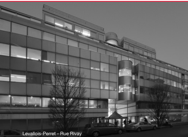
Levallois-Perret - Rue Rivay