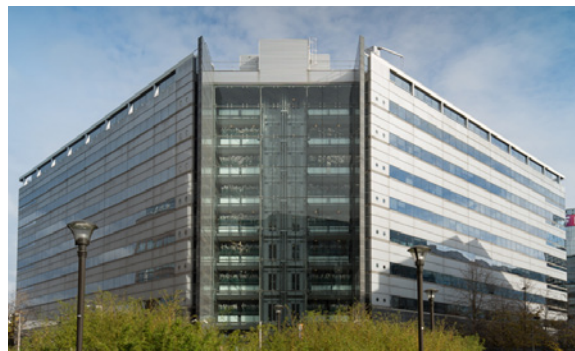
6 place Abel Gance - 92100 Boulogne-Billancourt