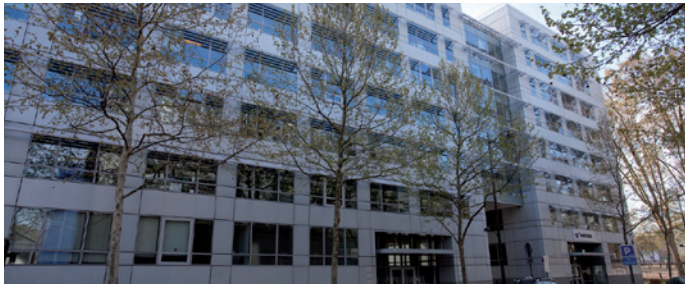
Paris - Pirogues