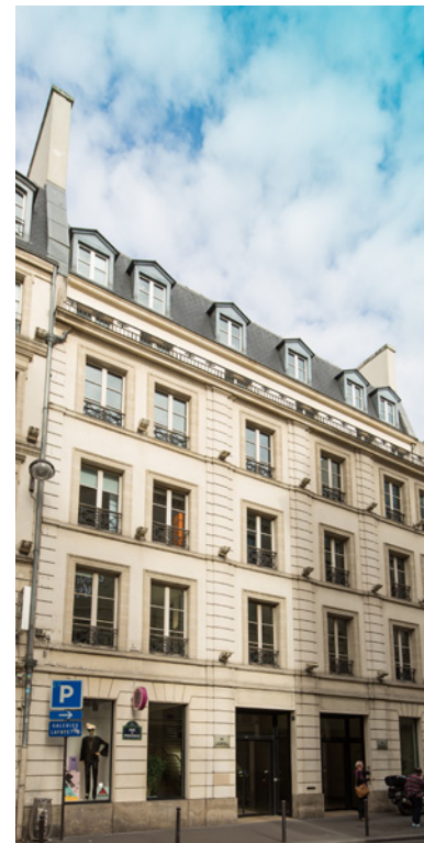
92-94 rue de Provence, 75008 Paris