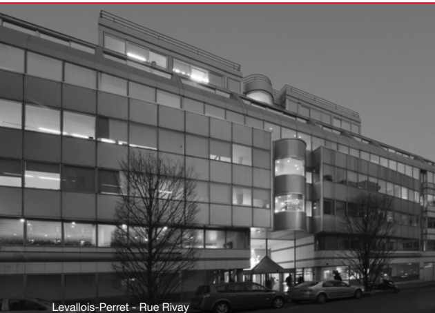
Levallois-Perret - Rue Rivay