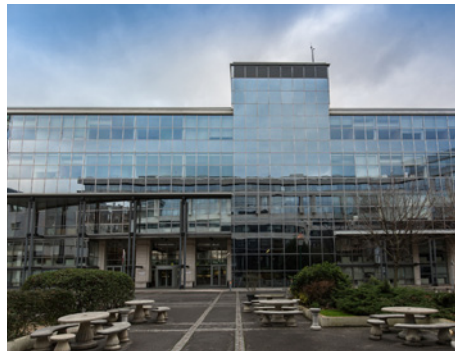
1 rue Giovanni Batista Pirelli 94110 St-Maurice