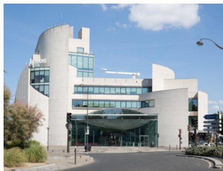
35 Rue de la Marne - 75013 Paris