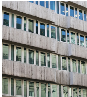
105 rue du Faubourg Saint-Honoré 75008 Paris