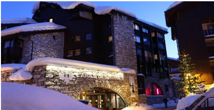
Val d'Isère - L'Aigle des Neiges