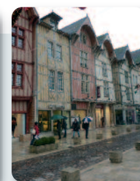
Troyes (10) – rue Emile Zola