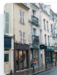
Saint Germain-en-Laye (78)