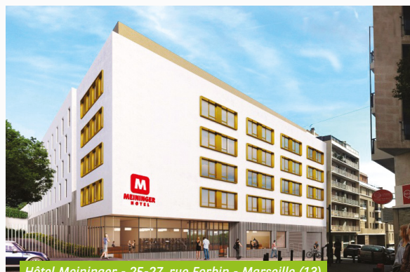
Hôtel Meininger - 25-27, rue Forbin - Marseille (13)

La distribution pour le trimestre, quant à elle, s'élève à 2,01 € par part (pour une jouissance pleine), sans changement par rapport aux trimestres précédents.